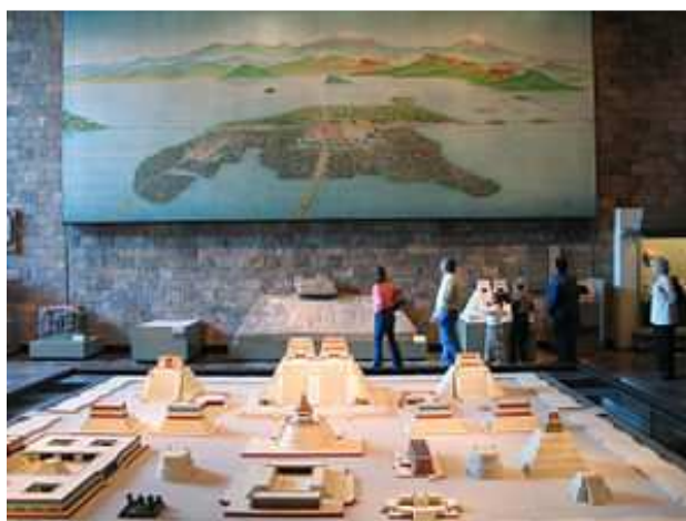
Model chrámové čtvrti. V pozadí celková rekonstrukce Tenochtitlánu.

vzdáleností, kterou domorodci museli překonávat při snášení svých pokladů, se celá akce zpomalovala a Španělé Montezumu zabili. V tom okamžiku však přísun ustal, domorodci své poklady ukryli, případně naházeli do vody nebo nepřístupných horských strží. V následném povstání vyhnali dobyvatele z města. Utíkající vojáci si nabrali zlata, kolik byli schopni unést a to se jim stalo osudným. Atékové přerušili mosty a můstky, kterými byly spojeny jednotlivé hráze, útočili z vody a dobyvatele vytlačili z města. Jenže – jak už to bývá, Španělům připluly posily a situace se nakonec obrátila. Aztécká říše byla vyvrácena, Cortéz zvítězil. Na místě bývalého aztéckého chrámu dnes stojí křesťanská katedrála postavená Španěly a aztécká kultura se stala vzpomínkou charakterizovanou celou řadou význačných architektonických památek, za kterými se běžně do dnešního města Mexika jezdí.